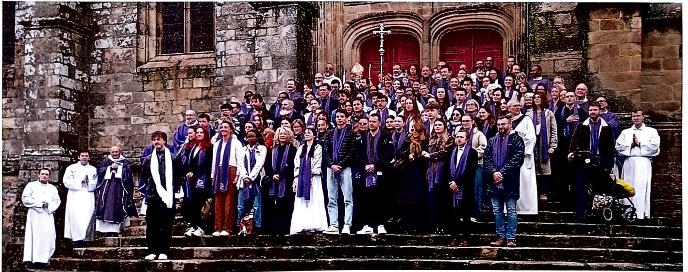
Rassemblement des Catéchumènes à Sérant