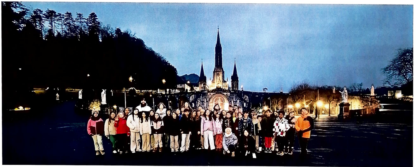
Visite à Lourdes