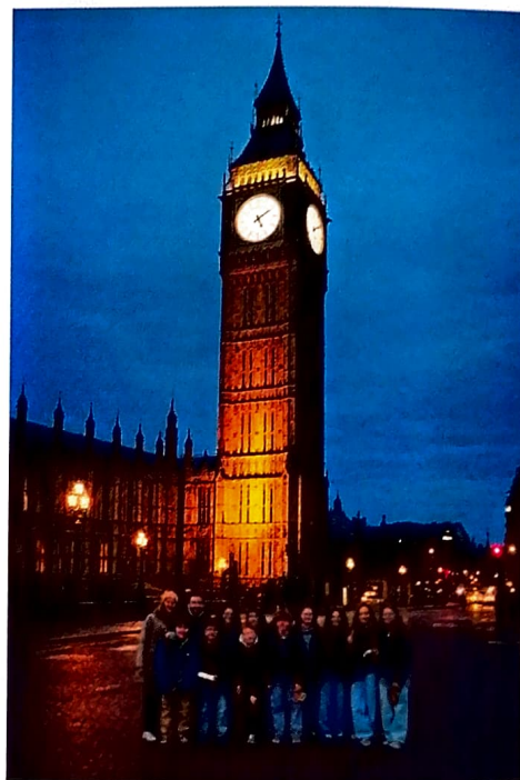
Visite à Londres

se vit également à travers des journées internationales, des projets culturels et linguistiques ou encore des voyages scolaires à l'étranger (Espagne, Angleterre, Allemagne), des jumelages (Kempton ou encore Dakkar). Pour beaucoup d'élèves, ces expériences sont marquantes et contribuent à leur donner confiance pour aller vers l'autre.